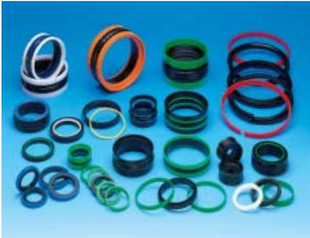
Enkelt- og dobbeltvirken- de Hydrauliktætninger